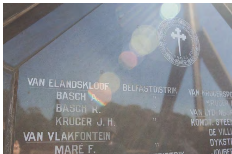
Basch-name by Bergendal