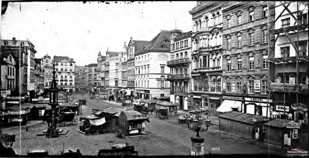
Breslau in 1873