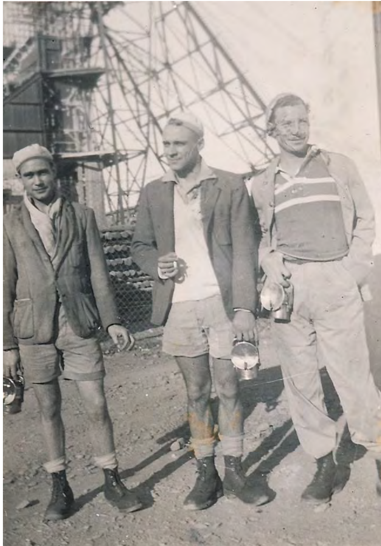
Drie onbekende Springs mynwerkers, vermoedelik Basch-vriende. Let op hul korbiedlampies, asook eie klere, in plaas van mynoorpakke